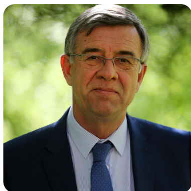
CHRISTOPHE BONDUELLE Président du groupe Bonduelle et de la Fondation Louis Bonduelle

2 experts indépendants choisis pour leur qualification dans le domaine d'intervention de la Fondation et 4 représentants des sociétés Bonduelle.